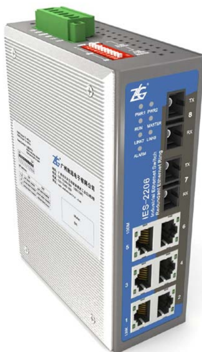
图 3.1 IES 系列交换机产品示意图